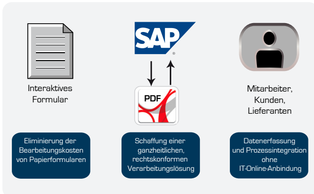
Abbildung: Grundidee interaktiver Formulare

Vor diesem Hintergrund wurde von der SAP AG in Zusammenarbeit mit Adobe® als Lösung das intelligente Formular entwickelt. Organisationen erhalten damit die Möglichkeit, aktuelle SAP®-Anwendungen in Verbindung mit einem Adobe® PDF-Formular bisher papierbasierte Geschäfts- und Kommunikationsprozesse effizienter und anwenderfreundlicher zu gestalten. Gleichzeitig kann der Einsatzbereich der SAP®-Anwendungen auf Mitarbeiter, Kunden und Lieferanten, die bisher keine direkte System-Anbindung hatten, ausgeweitet werden.